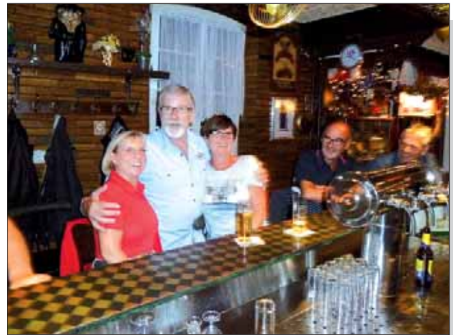
Abschied mit Stammgästen

de nach einer Alternative um. Nach einer besonders gründlichen Umschau im Hause seiner Eltern kam ihnen die Idee, das denkmalgeschützte Gebäude, erbaut AD 1801, auf der Ecke der Alten Neußer Landstraße und der St.-Tönnis-Str. könnte nach entsprechenden Umbaumaßnahmen ein gemütliches Kneipenrestaurant abgeben. Nur Behörden und Eltern fanden die Idee am Anfang mehr als gewöhnungsbedürftig. Das tatkräftige Paar ließ sich davon aber nicht abschrecken und fing mit dem Umbau an, nachdem die Eltern wieder einmal zu einem längeren Italienurlaub aufgebrochen waren und folglich nicht widersprechen konnten. Nach Eröffnung der Gaststätte vor Sylvester 1967 ließen sich nicht nur die Worringer Gäste, sondern auch Theos Eltern vom Konzept begeistern und bald sprach es sich in Worringen und den umliegenden Dörfern herum, dass man im Burghof nicht nur gemütlich ein Bier trinken, sondern auch sehr lecker essen könne. Kurze Zeit später wurde das Nebenhaus (AD 1921) mit einbezogen. Es gab Zimmervermietung und im Keller des Hauses übte jah-