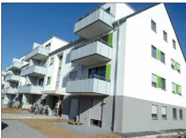
Die ersten Bewohner konnten bereits einziehen

Die Schlüssel für die Wohnungen im ersten – frei finanzierten – Gebäudeteil konnte die GWG bereits Mitte Oktober an ihre Mieter übergeben. Die im zweiten Projektabschnitt liegenden 33 öffentlich geförderten Wohnungen werden in einigen Wochen fertig gestellt.