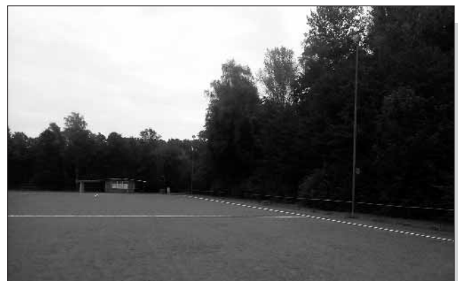
Tristesse auf dem Sportgelände der SG Worringen

Wie aber im September bekannt wurde, verzögert sich nun der Austausch der Flutlichtanlage: „Die Planung der elektrotechnischen Anlagen durch eigene Mitarbeiter ist aus Kapazitätsgründen derzeit leider nicht möglich“, hieß es in einem Brief der Gebäudewirtschaft ans Sportamt. Nun muss ein externer Ingenieur die Planungen leisten. Die Vergabe jedoch benötigt mindestens drei Monate. Außerdem muss ein Bauantrag gestellt werden, da es sich in Worringen um eine Komplett-Er-