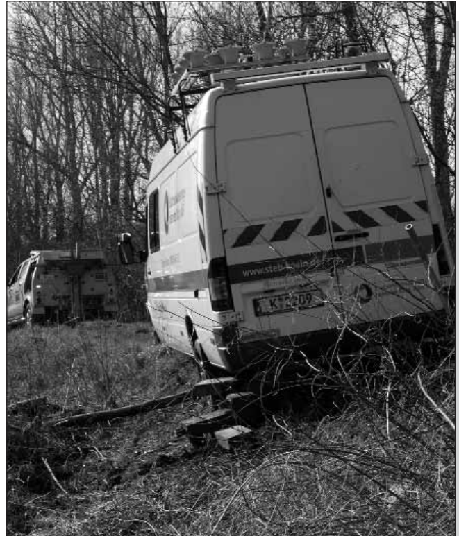
Gerade noch mal gut gegangen: Bergung des StEB-Fahrzeuges

der Eindruck entsteht, als wolle das Worringer Bruch sagen: „Lasst mich in Ruhe, ihr Planer, Dammbauer,