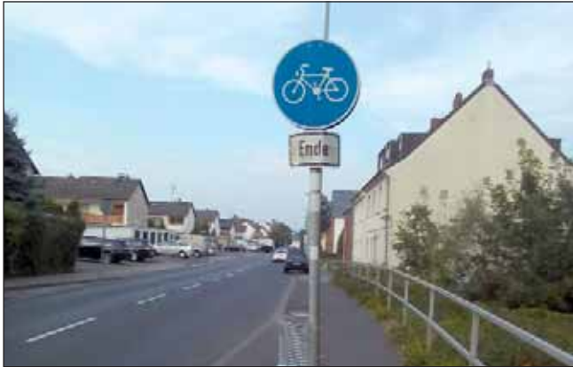
Böse Falle für ahnungslose Radler

Sie kennen sicher Schilda, der fiktive Ort, nach dem die Schildbürgerstreiche benannt worden sind. Viele Orte nehmen heute für sich in Anspruch, die Verhältnisse in ihrer Stadt seien seinerzeit die Vorlage für die Berichte von Schilda gewesen. Und wie sieht es mit Worringer aus?