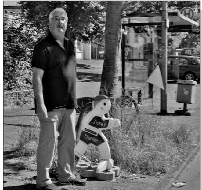
23.08.2016 Grundschule An den Kaulen