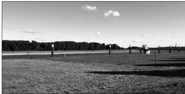
Hier werden die neuen Tankerbrücken entstehen

Das Verkehrsaufkommen rund um Köln wächst stetig. Auch die A57, die an Worringen und dem Chempark Dormagen direkt vorbeiführt, wird regelmäßig bei den Verkehrsnachrichten aufgeführt. Also ist es die logische Folge, dass das Unternehmen INEOS gemeinsam mit dem Dormagener Chempark die Anzahl der Tankerbrücken am Rhein erwei-