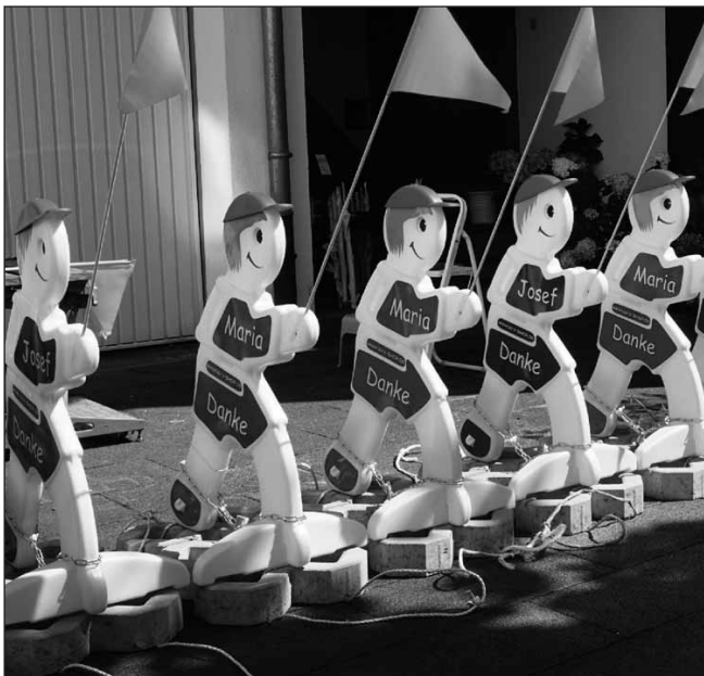
23.08.2016 Die freundlichen Hinweiser