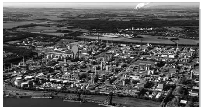
Hier soll die neue GuD-Anlage entstehen

Der Genehmigungsantrag wurde bei der Bezirksregierung Köln eingereicht. Es handelt sich um ein Genehmigungsverfahren mit