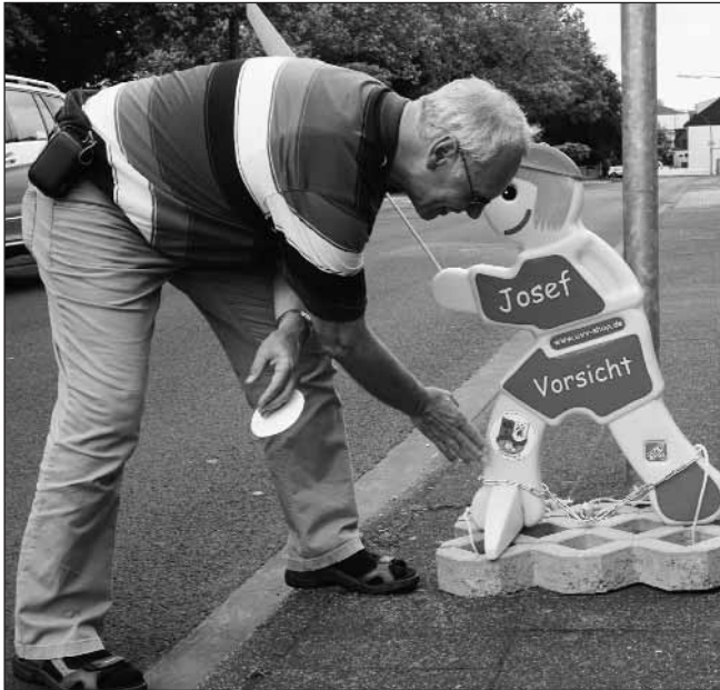
27.05.2016 Aufpasser am Flüchtlings-Wohnheim – im Auftrag des Bürgervereins