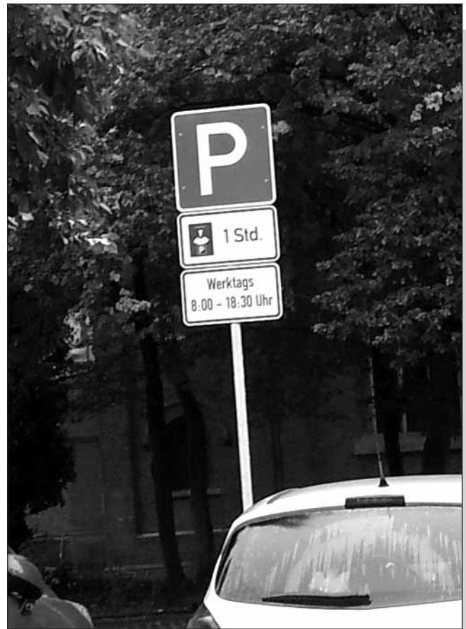
Neu: Parkscheibenpflicht auf dem St.-Tönnis-Platz

Grundsätzlich sind diese Maßnahmen zu begrüßen und ein erster Schritt in die richtige Richtung. Das Ortszentrum von Worringer benötigt dringend ein Verkehrskonzept, welches für mehr Sicherheit sorgen muss und ein Abwägen der Interessen aller Verkehrsteilnehmer in den Blick nimmt. Wünschenswert ist jetzt natürlich, dass die