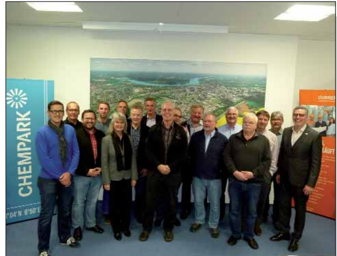
BV-Vorstände zu Besuch im Chempark

wie die Inhalte und die Veranstaltungsformate, mit denen der Chempark-Betreiber Currenta den Dialog im Werksumfeld führt. Leitlinie der Erklärarbeit ist dabei stets die Frage „Was hast Du davon?“ – Was haben die Bürgerinnen und Bürger der Region vom Chempark? Als Ausbilder. Als Arbeitgeber. Als sicher und verantwortungsvoll