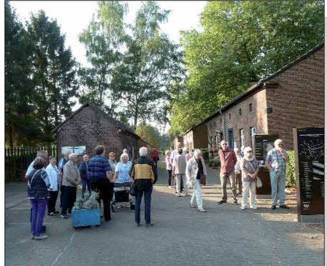
Die Reisegruppe in der Siedlung Eisenheim

Grund des schönen Wetters auf dem 120 m hohen Gasometer eine tolle Aussicht auf das Ruhrgebiet genießen. Für manchen Teilnehmer hätte die Zeit am Gasometer noch länger sein können.