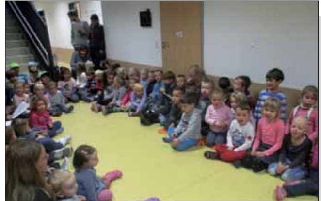
Die Kita-Kinder in Vorfreude auf das große Fest

Am letzten Tag wurde es nochmal knapp und so wurde auch noch der Oma im Sauerland und der Tante in Kanada erklärt, wie das mit dem Abstimmen funktioniert. Dieser Einsatz wurde belohnt, am Ende setzte sich Kiku Kinderland