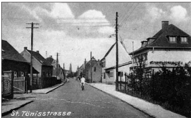
Postkarte mit Straßenansicht der St.-Tönnis-Straße

Wüste im oberen Niltal, in deren Höhlen Christen vor den Verfolgungen des römischen Kaisers Decius flüchteten und ein frommes Leben führten.