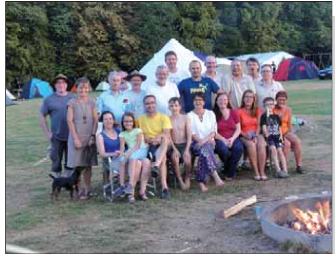
Wir waren dabei – beim „Alte Säcke“- Lager

Wir haben uns sehr gefreut, als uns die ersten Anmeldungen erreichten. Am letzten Augustwochenende sollte es dann losgehen. Am Donnerstag haben wir in Langel die Zelte, die Gaskocher und feudalerweise einen Kühlschranks in den Anhänger gepackt und am Freitagmorgen sind dann die ersten schon mal zum Aufbauen los gefahren. Wir hatten fantastisches Wetter mit blauem Himmel und gefühlten 40°C im Schatten. So macht Zelten richtig Spaß. Wie früher arbeiteten