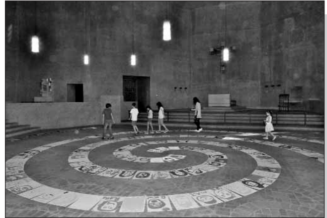
Kinder besuchen ihre Ausstellung

bewegend, wie die Kinder aus vielen Nationen das Thema „Selbstportrait“ mit viel Kreativität umgesetzt haben.