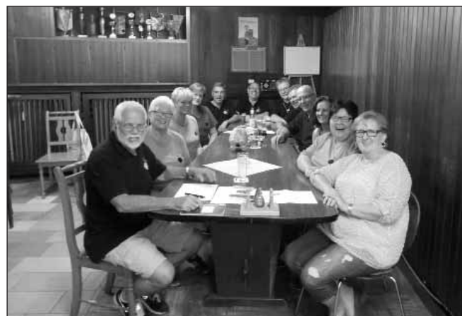
So sehen Sieger aus, „Die Lotterhaften“ in heimischer Kulisse