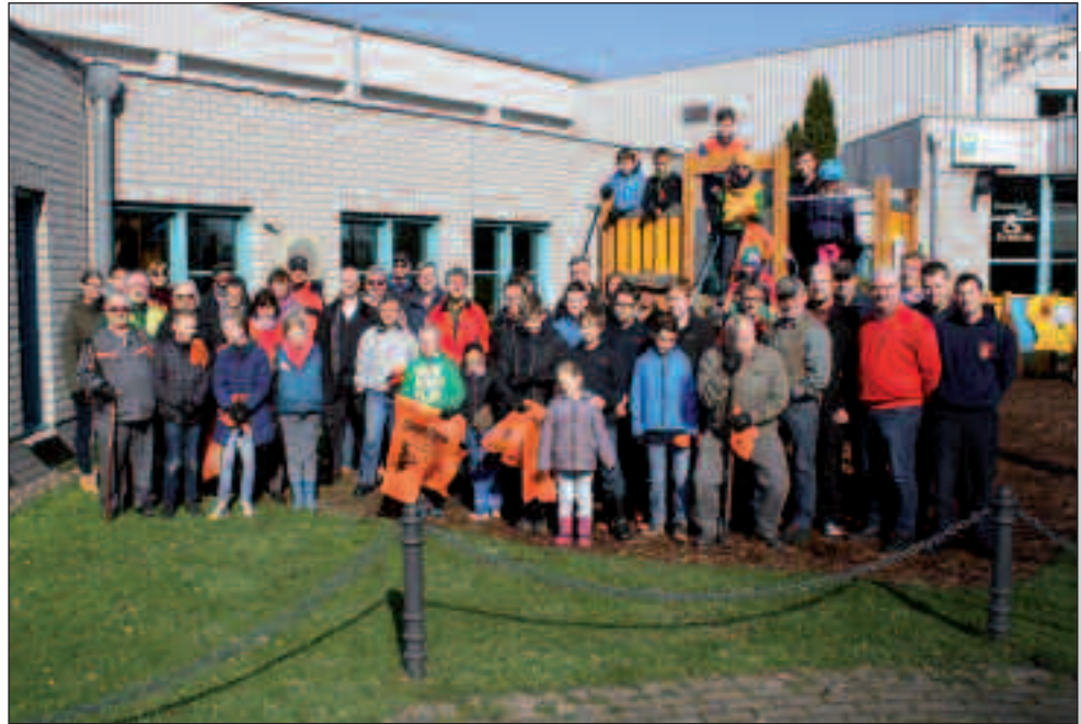
Die fleißigen Helfer

Sie alle konnten beim Start auf Sammelgebiete verteilt werden. Vorwiegend waren das die Naturschutzgebiete Worringer Bruch und die Rheinaue. Gesammelt wurde aber auch auf einigen wenigen privaten Grundstücken an der Alte Straße und im Umfeld der ehemaligen Hauptschule.