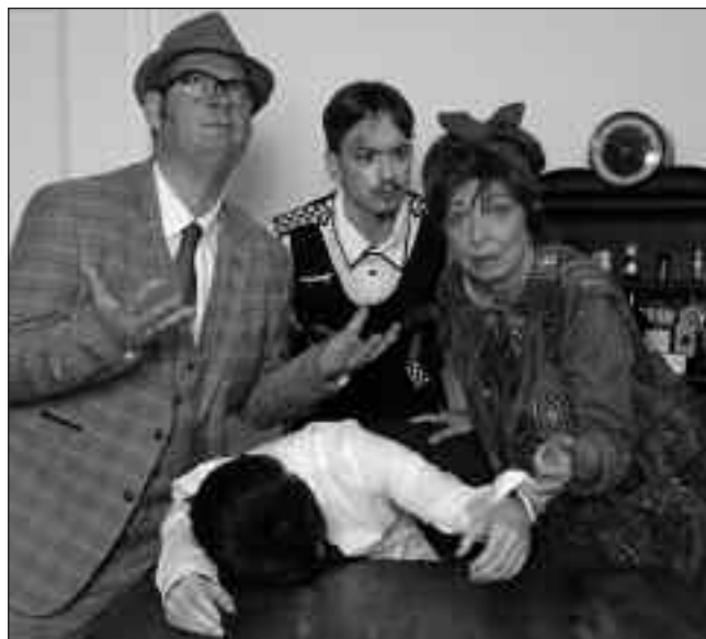
Nein, was die Leute alles im Büro herumliegen lassen

Sehr beliebt, besonders bei den jungen Zuschauern, sind die Winterstücke des Amateurtheaters. Die Aufführungen fanden bisher immer an einem Adventswochenende im Dezember statt. Hier möchte die Dramatische Vereinigung einmal neue Wege gehen. „Wir haben uns entschieden, auszuprobieren, ob Aufführungen im Frühling noch mehr Zuschauer zu uns ins Vereinshaus locken würden“, so die er-