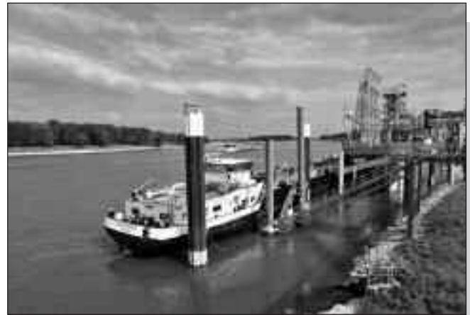
Ein Schiff im Hafen am Chemepark Dormagen

Gemeinsam mit dem Chemieunternehmen INEOS in Köln plant Currenta, im Hafen am Chemepark Dormagen zwei neue Tankerbrücken zum Umschlagen flüssiger und gasförmiger Fracht zu errichten. Die neuen Anlagen ermöglichen eine schnellere Abfertigung der Schiffe und erhöhen die Menge der verladenen Stoffe. Dazu wollen die Vorhabenträger insgesamt 35 Millionen Euro investieren. Die Tankerbrücken sollen nördlich der bereits bestehenden fünf Anlagen im Rheinvorland errichtet werden. Die Anträge zur Errichtung und zum Betrieb der Tankerbrücken werden voraussichtlich im Frühsommer