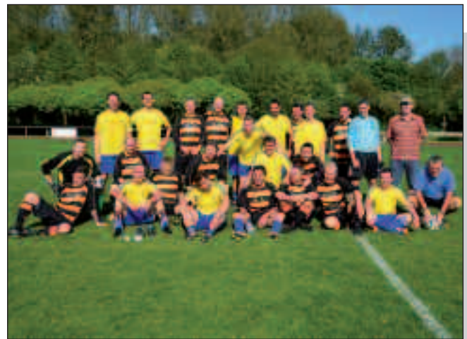
Vor dem Anpfiff

Schon seit Jahren unternimmt die „Alte Herren“ aus Thirsk alljährlich eine Mannschaftstour, die traditionell ins kontinentale Europa führt und immer ein Freundschaftsspiel gegen eine örtliche Alte-Herren-