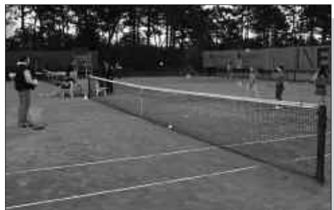
Viel los auf dem Tennisplatz

Am Ende des Tages zogen die Veranstalter eine zufriedenstellende Bilanz, man hätte sich allerdings mehr Zuspruch der Ortsvereine gewünscht. Vielleicht können in der laufenden Saison noch einige Besucher begrüßt und für den Tennissport begeistert