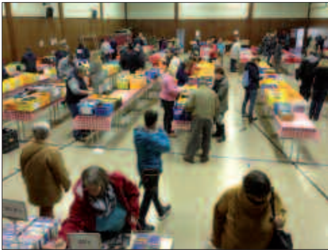
Große Auswahl lädt zum Stöbern ein

Ihren 15. Büchertrödelmarkt veranstaltete die Kolpingsfamilie Worringer am Sonntag, den 24.04.16 im Vereinshaus. Geschätzte 10.000 Bücher standen den Kunden zur Auswahl. Die Bücher stammen aus Spenden von Worringer Bürgern. Gut sortiert nach Themen konnte so jeder Besucher Bücher nach seinem Leseschmack aussuchen. Sage und schreibe 3.250 Romane, Krimis,