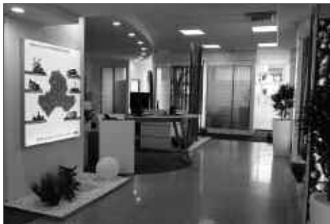
Ein Blick in die neu eröffnete Geschäftsstelle Worringen

Die frisch renovierte Geschäftsstelle erstrahlt in neuem Glanz und vereint diskrete Beratungsmöglichkeiten, modernste Technik und wohnliches Flair