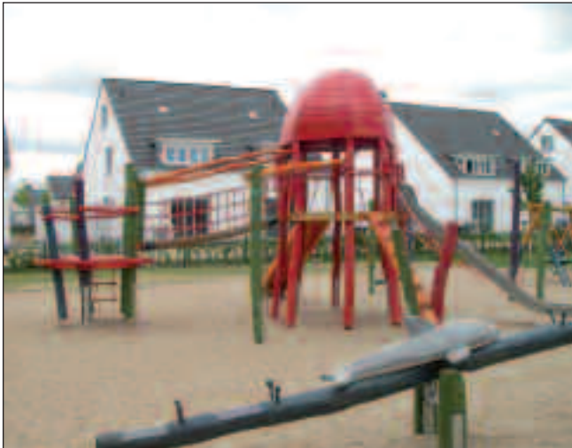
Spielplatz Hackhauser Weg

den: Dies ist ein ausgewiesener Spielplatz und kein Hundeklo!