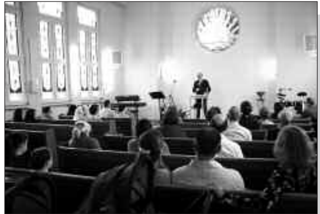
Blick in den Gemeindegottesdienst – Gäste sind hier willkommen

Es sei wichtig nicht nur materiell Hilfe zu leisten, ein weiterer wichtiger Punkt sei es die Herzen zu heilen und mit Hoffnung und Freude zu erfüllen, erklärten Gemeindeglieder.