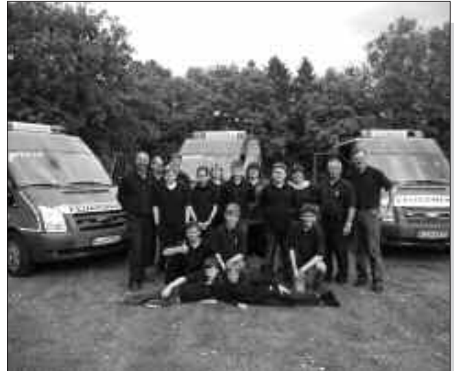
Die Worringer Jugendfeuerwehr mit ihren Betreuern

Außerdem übernimmt die Jugendfeuerwehr sehr wichtige Aufgaben im Bereich der Jugendarbeit. Neben Spaß und Vergnügen auf der einen Seite steht hier auch Lernen ganz weit oben. Alle zwei Wochen dienstags trifft sich die Jugendfeuerwehr Worringen um 17.45 Uhr am Gerätehaus, Hackenbroicher Straße. Die Ausbildung umfasst alle Grundtätigkeiten im Feuerwehrdienst (z.B. Schläuche rollen, Knoten und Stiche, Bestückung der Fahrzeuge und Einsatzübungen), sowie Übungen von Geschicklichkeit, Beweglichkeit und Allgemeinwissen. Man absolviert in der Zeit in der Jugendfeuerwehr diverse Leistungsabzeichen, durch die das Fachwissen nachgewiesen wird. Kameradschaft wird hier ganz groß geschrieben, neben dem jährlichen Zeltlager gibt es immer wieder