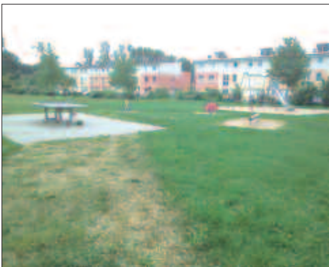
Spielplatz auf dem Krebelspfad