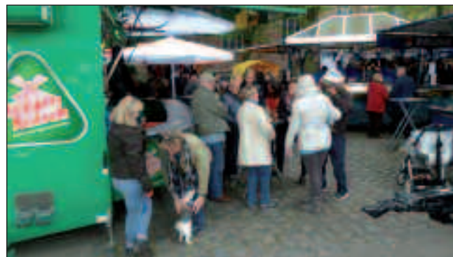
Möge das Kölsch mit dir sein

Auch 2017 soll die Biermeile wieder stattfinden. Über eine Erweiterung der Biersorten in Form von verschiede-