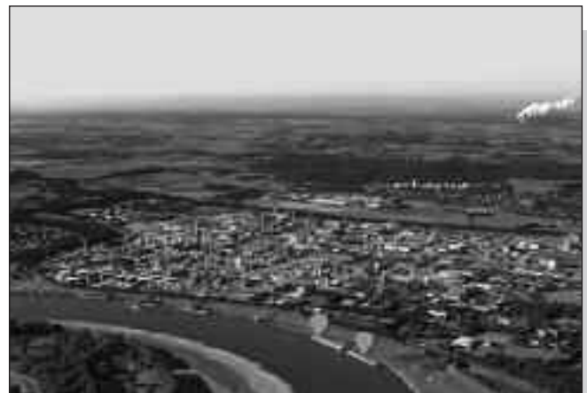
Hier entstehen die neuen Tankerbrücken

2016 bei den zuständigen Behörden eingereicht. Die Bauphase soll 2017 beginnen. Für die geplanten Tankerbrücken wird keine neue Querung der B9 benötigt, so dass der Verkehr auf der B9 während der Bauphase nicht eingeschränkt sein wird