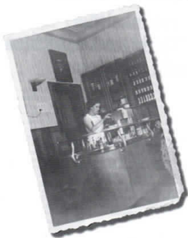
„Uns Moni“ in ihrem ersten Jahr der Selbstständigkeit im Jahre 1959.

Ihr Meisterbetrieb für Dachdeckerei · Bauklempnerei Schieferbedachungen Flachdachisolierungen Fassadenarbeiten