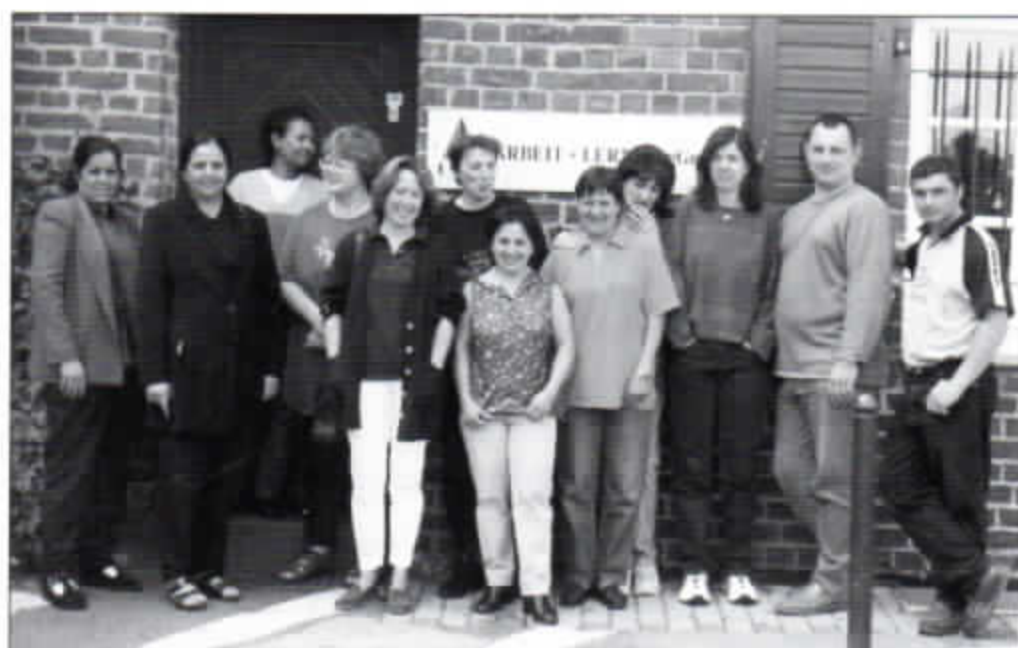
Mitarbeiter und Projektteilnehmer der gemeinnützigen Arbeit und gGmbH vor dem Büro.

Die Arbeit + Lernen gGmbH bietet zwei Projekte für arbeitslose Frauen an: Den mobilen hauswirtschaftlichen und sozialen Dienst und die Gebäudereinigung