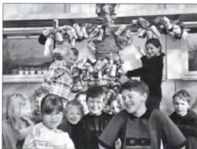
Die Grundschüler und ihr Müllmonster

Eine andere Gruppe verscrieb sich dem Instrumentenbau. Hier wurden die verschiedensten Materialien verwendet. Auch diese Gruppe führte ihre Instrumente eindrucksvoll vor. Auf dem weiteren Programm standen die verschiedensten Bastelarbeiten. So wurden eifrig Marienkäfer und anderes Getier gebastelt. In einer Steinmetzwerkstatt wurden aus Leichtbausteinen Tiere hergestellt. Eine Naturgruppe beschäftigte sich mit den Frühlingsblumen. Diese wurden betrachtet, aber auch noch neue Blumen zur Schulverschönerung gepflanzt.