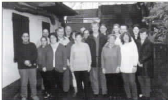
Der neue Vorstand der KG Närrische Griellächer freut sich auf „viel Arbeit“ im Jubiläumsjahr.

Große KG hat ihrem Präsidenten viel zu verdanken