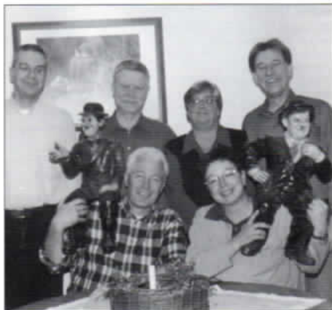
Der am 30.3.01 gewählte geschäftsführende Vorstand der Dramatischen Vereinigung mit „kleiner“ Unterstützung.