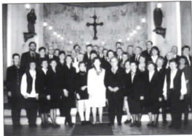
Der Kirchenchor freut sich auf viele Besucher im Jubiläumsjahr.

Anfang der Sechziger Jahre sorgte man sich ernsthaft um