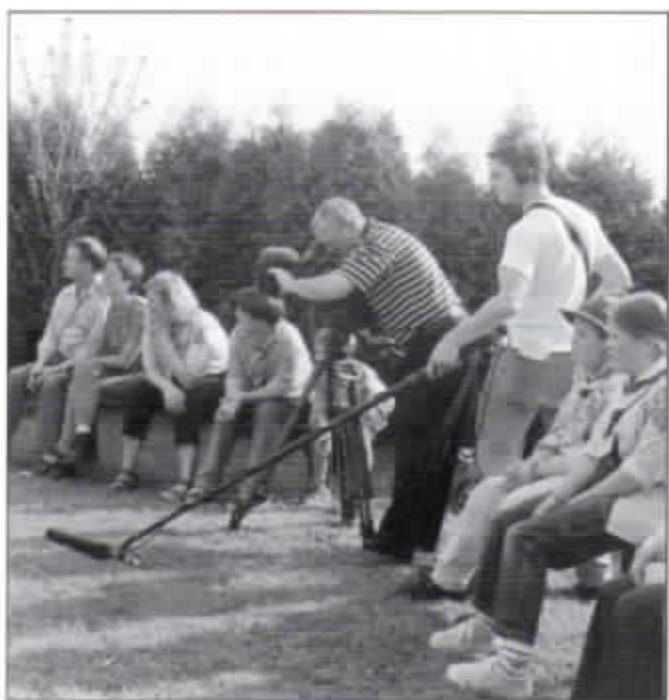
Sogar der amerikanische Fernsehsender CNN filmte die Begegnung zwischen deutschen und südafrikanischen Scouts.

Doch wie so jeder Tag ging auch dieser irgendwann zu Ende. Schnell wurden noch Adressen, Pfadfindertücher und -aufnäher getauscht, bis sich die südafrikanischen Pfadfinder wieder auf zu weiteren Entdeckungsreisen durch Deutschland machten.