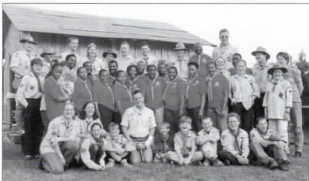
Erinnerungsfoto vor dem Pfadfinder-Haus in Langel.

In der Zwischenzeit war auf dem Grundstück schon alles für die Ausflügler vorbereitet worden. CNN (ein internationaler Fernsehsender) hatte sich für 18.00 Uhr ange-