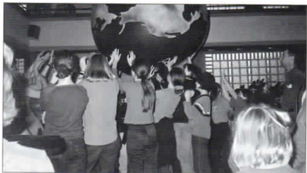
Einen Erdballtanz gab es beim Abschlussgottesdienst des Gemeindefestes.