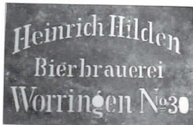
Zu den wenigen Überresten der alten Gerstensaftproduktion zählt diese Druckvorlage zum Beschriften der Fässer.