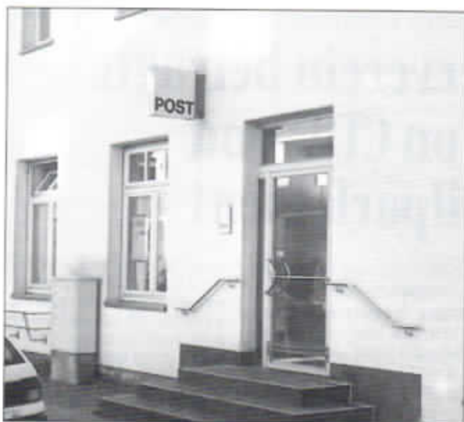
Nur noch eine unbestimmte Gnadenfrist ist dem Postamt an der St.-Tönnis-Straße beschied.

Bürgerverein erfuh von Schließungsplänen