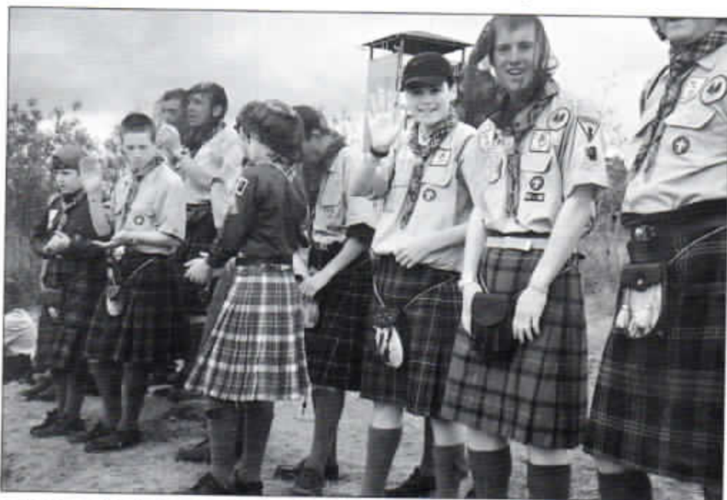
Schottische Pfadfinder beim Welttreffen in Island.

Dieses Jahr luden wieder die isländischen Pfadfinder zu ihrem „Landsmót Skáta“ ein – dem isländischen Jamboree, welches alle drei Jahre stattfindet. Zwölf Leiterinnen und Leiter unseres Stammes folg-