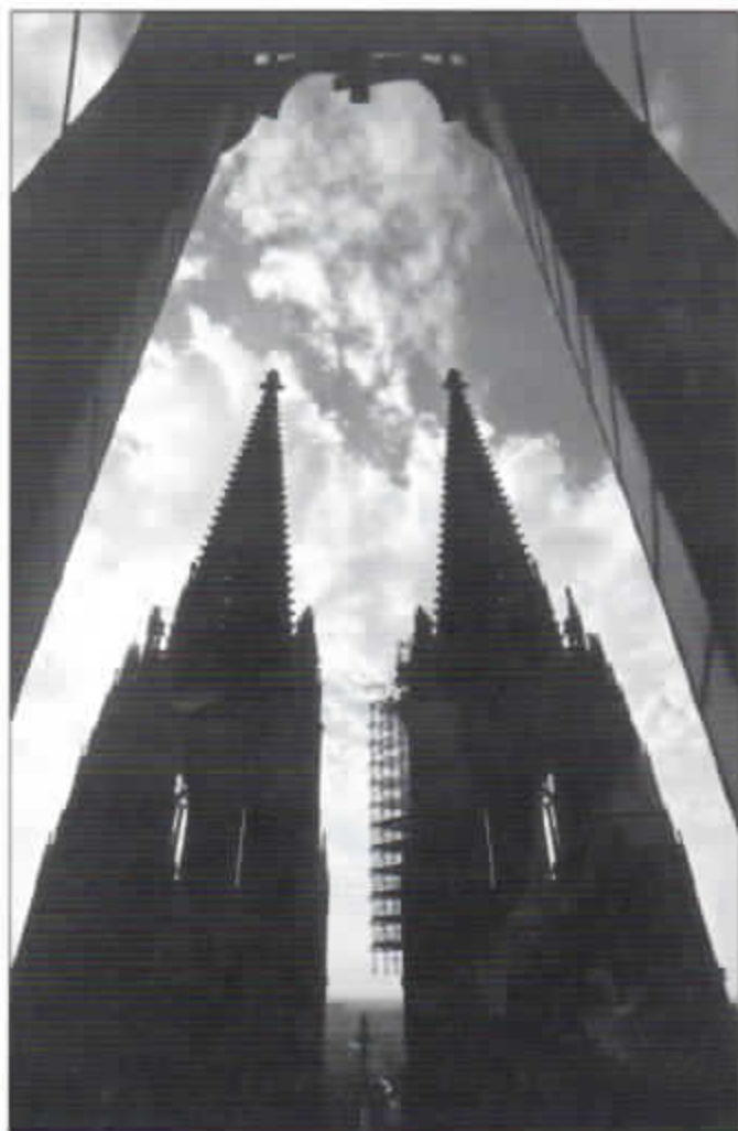
Der Dom – die ewige Baustelle.