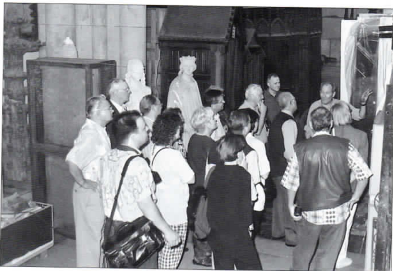
Wie bei uns am Speicher...

Wenn's mal eng wird – Abfallverwertung ohne Vorsortierung