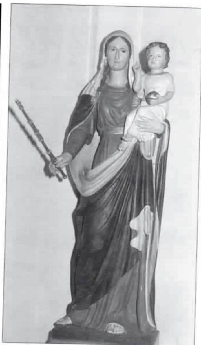
An seinem neuen Platz in der Pankratiuskirche kommt das Gnadenbild wesentlich besser zur Geltung.

50769 Köln-Worringen In der Lohn 47 · Telefon 02 21/78 10 61