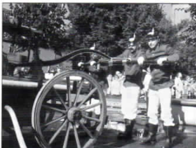
Rauf und runter: Die Worringer Wehr in schwerem Einsatz an der Handdruckspritze.

Zum Abschluss möchten wir uns bedanken bei unserem Publikum, den Sponsoren sowie den zahlreichen Helfern aus den Reihen der L.G. Worringen.