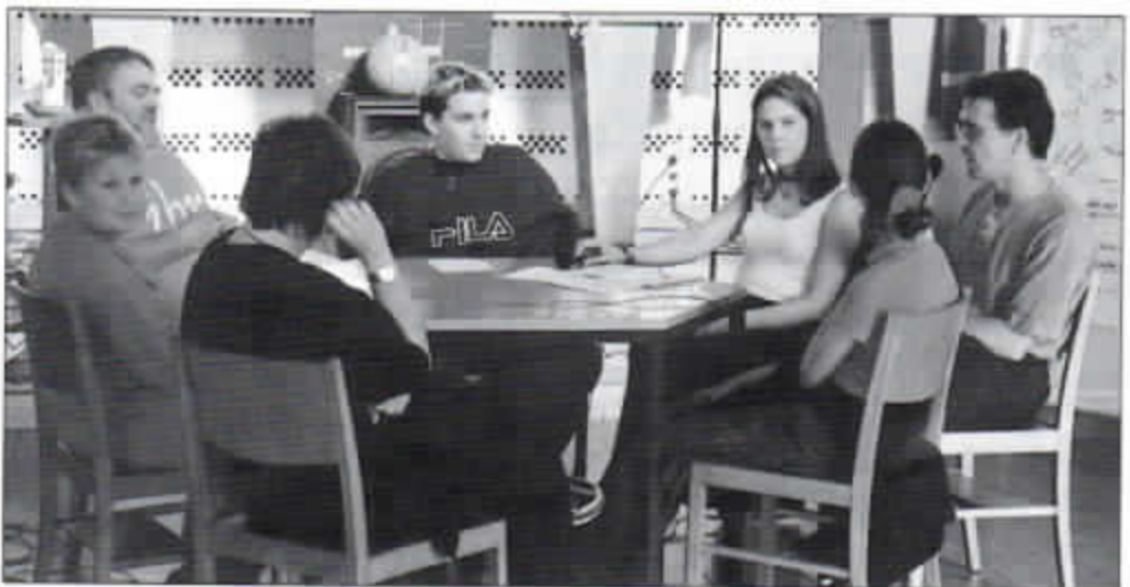
Diskussionsrunde zum Thema „Typisch Jugendliche, typisch Erwachsene.“

„Typisch ...“ ging es um die Frage, was Jugendliche über Erwachsene und was Erwachsene über Jugendliche denken. Zum Beispiel: „Jugendliche sind oft unzuverlässig“. „Aber“, so lautete die Gegenfrage, „wie oft halten Erwachsene ihre Versprechungen nicht?!“. Erwachsene wollen, dass die Jugendlichen aktiv sind („nicht nur rumhängen“), aber in den von ihnen vorgeschriebenen Grenzen. Jugendliche empfinden die Aktivitäten der Erwachsenen oft als eingefahren und fest-