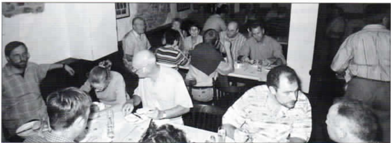
Kellergespräche beim „Früh“.