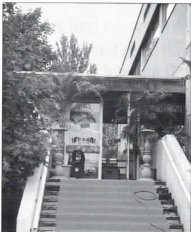
RTL rollte den roten Teppich am Eingang des alten Hallenbades aus. Für die neue Serie „Zeichenblues“ wurde es in ein Fitness-Studio verwandelt.