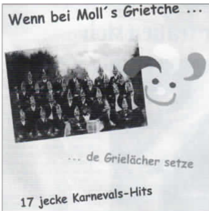
So sieht das Cover der neuen Prinzen-CD aus, auf der sich 17 Titel der NÄRRISCHEN GRIELÄCHER befinden.