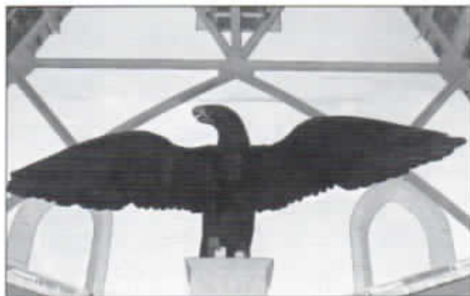
Immer, wenn der Kaiser kam... Der Preußenadler.