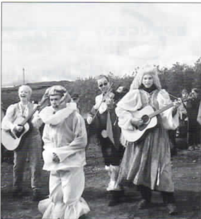
Musikalische Begrüßung der Gäste.

Nach einer Woche in Island war auch den „Islandneulingen“ klar, dass Island nicht nur eisig ist. Die Isländer sind meist freundlich und hilfsbereit. Das Wetter ändert sich dort sehr oft und sehr schnell. Manchmal wechselt es innerhalb von 10 Minuten von bitter kalt zu sonnig warm. Erschöpft, aber froh und reich beschenkt mit vielen neuen Eindrücken, Freunden in Island und überall auf der Welt und vielen schönen Erinnerungen verließen wir Island. Wir freuen uns auf das nächste „Landsmot Skáta“ 2002.